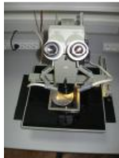
Мікроскоп ЛОМО МСПЭ-1